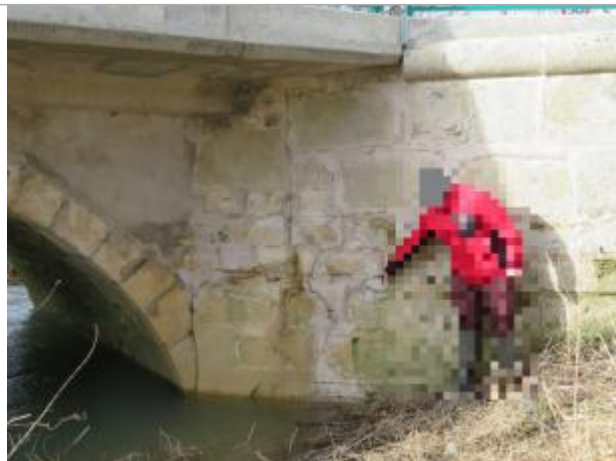
Amont du pont en rive droite