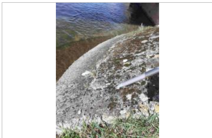
Limite de végétaux sur le béton, en amont RD du pont

Altitude calculée de l'eau (en m) : 180.664