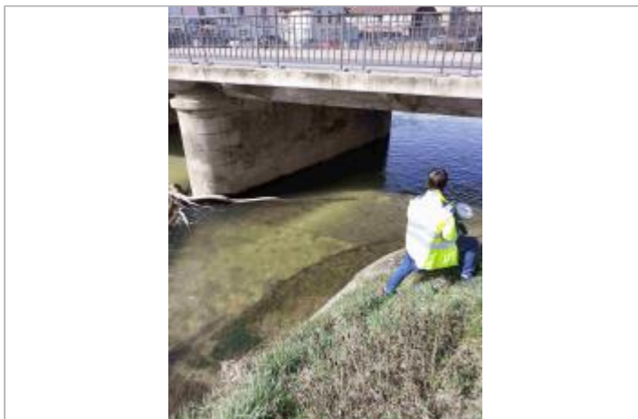
Rebord en béton