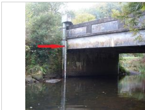
Echelle limnimétrique en aval du pont rive droite

Altitude calculée de l'eau (en m) : 91.71 m