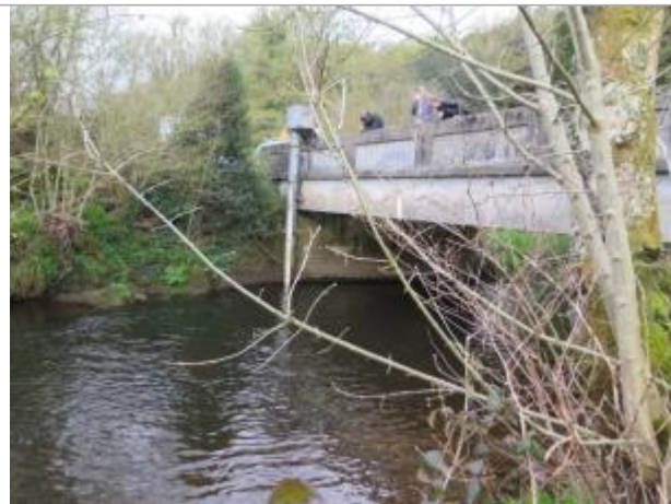
Station limnimétrique de l'Isole à Scaër

Coordonnées WGS84 : X: -3.67117600 / Y: 47.98791660