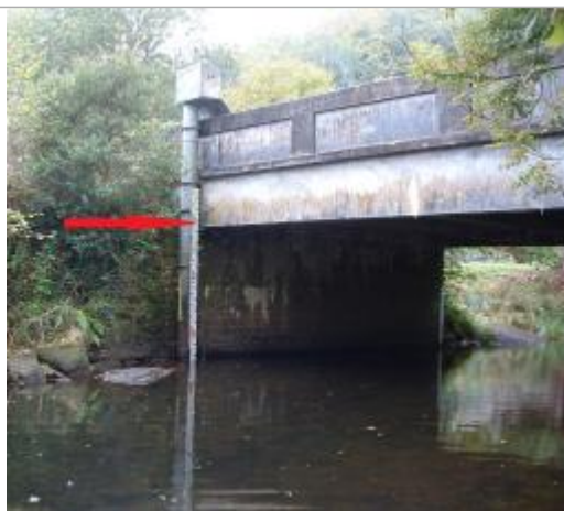
Echelle limnimétrique en aval du pont rive droite

Altitude calculée de l'eau (en m) : 91.55 m