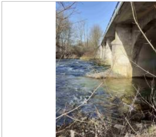
Aval du pont, rive gauche