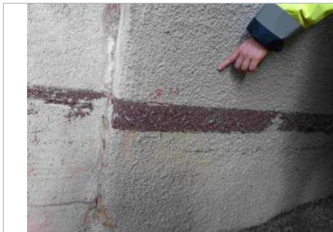
Marque à l'aval du pont en rive gauche

Altitude calculée de l'eau (en m) : 197.831 m