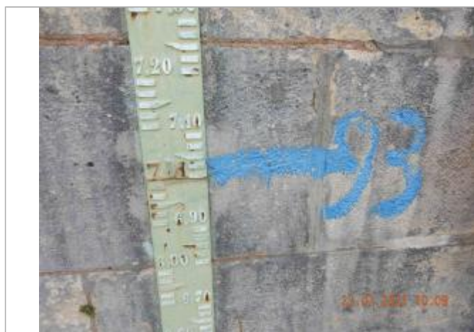
Inscription peinte "1993" sur échelle limnimétrique.