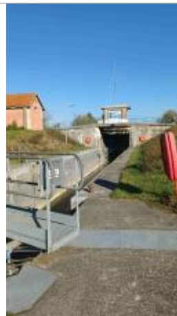
Echelle limnimétrique sur mur de l'écluse, rue des Ecluses.