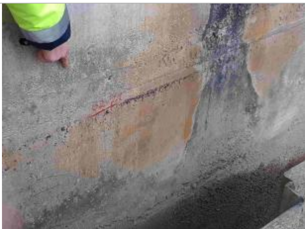
Marque faite sur le pont, amont rive gauche

Altitude calculée de l'eau (en m) : 205.522