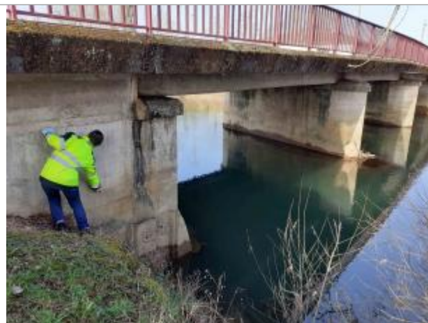
Amont du pont en rive gauche