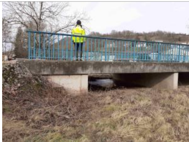
Amont du pont de décharge, sur la D5