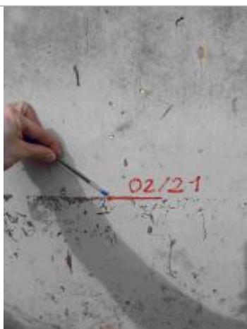
Marque sur le pont de décharge, en amont rive gauche

Altitude calculée de l'eau (en m) : 233.281