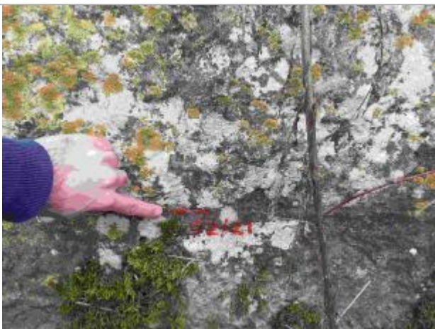
Marque en amont rive droite sur le pont

Altitude calculée de l'eau (en m) : 228.628 m