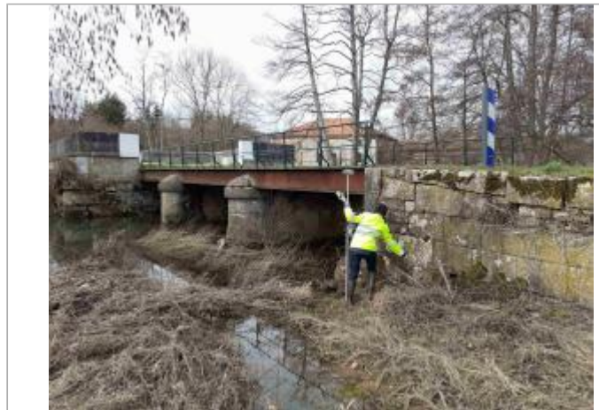
En amont du pont sur l' Orvain