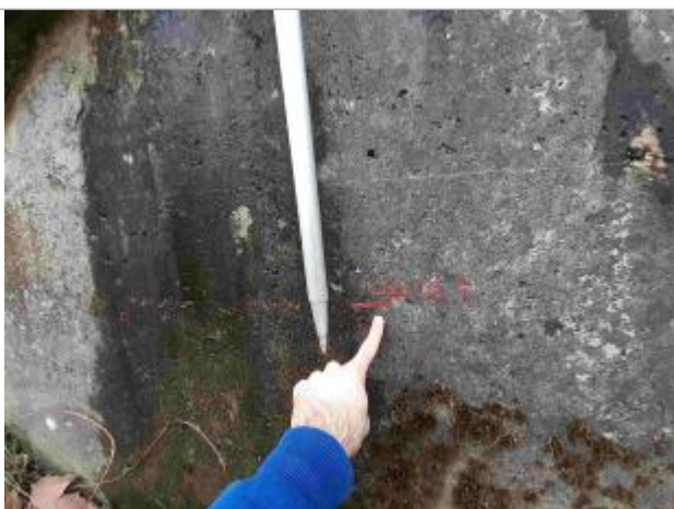
Marque sous le pont, aval rive droite

Altitude calculée de l'eau (en m) : 223.751