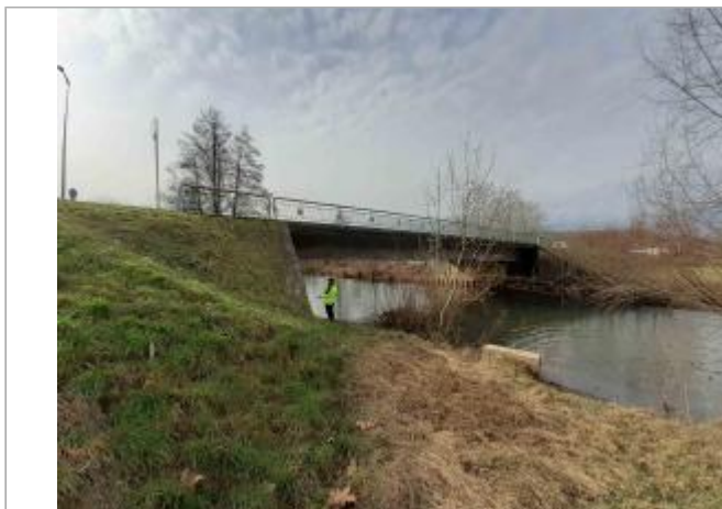
Aval du pont