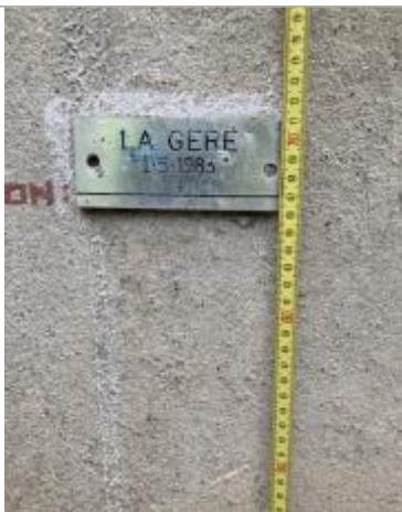
plaque posée sur le mur du bâtiment