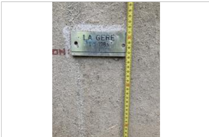
plaque posée sur le mur du bâtiment