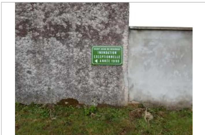
plaque (type plaque de rue) posée sur le mur arrière du bâtiment