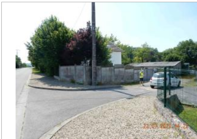
Portail en fer gris au 22 rue du Port