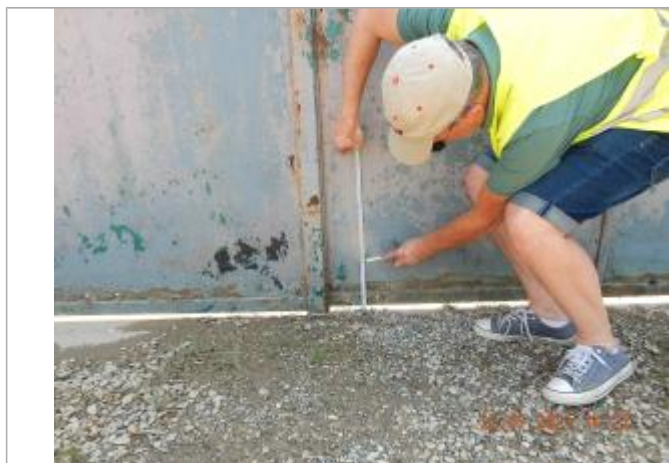
Laisse de débris végétaux sur portail métallique à 19 cm/sol

NIVELLEMENT SPC SACN. LE SPC N'EST PAS GÉOMÈTRE EXPERT, LES COTES SONT DONNÉES À TITRES INDICATIF. - 28/10/2021