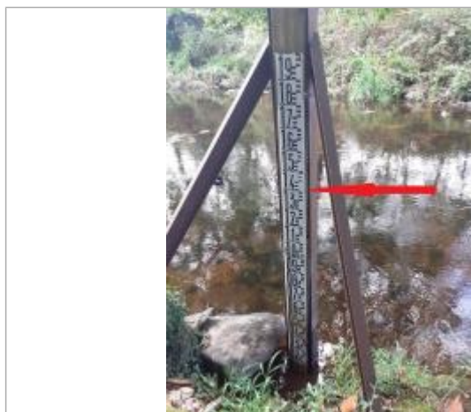
Echelle limnimétrique en aval du pont

Altitude calculée de l'eau (en m) : 76.88 m