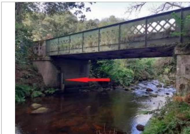
Pont de la RD 132 entre Priziac et Le Fauët vue de l'aval