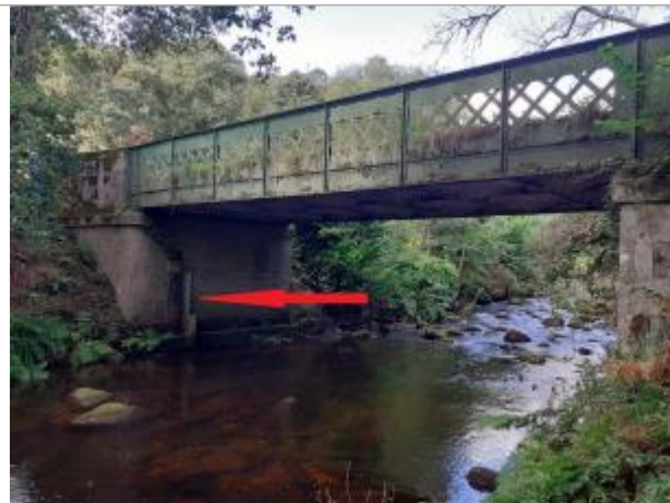
Pont de la RD 132 entre Priziac et Le Fauët vue de l'aval