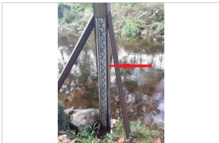
Echelle limnimétrique en aval du pont

Altitude calculée de l'eau (en m) : 76.86 m