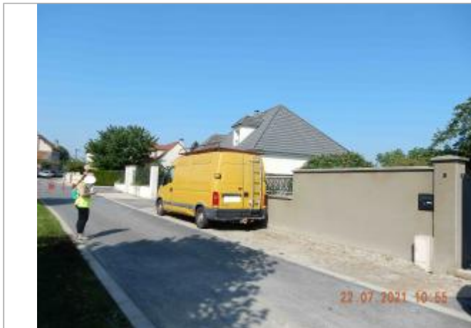
Chaussée face au n°3 de la rue de l'ancienne place

Coordonnées WGS84 : X: 3.90135750 / Y: 49.40216700