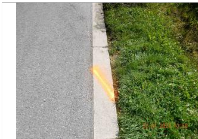
Laisse de crue sur la chaussée

NIVELLEMENT SPC SACN. LE SPC N'EST PAS GÉOMÈTRE EXPERT, LES COTES SONT DONNÉES À TITRES INDICATIF. - 28/10/2021