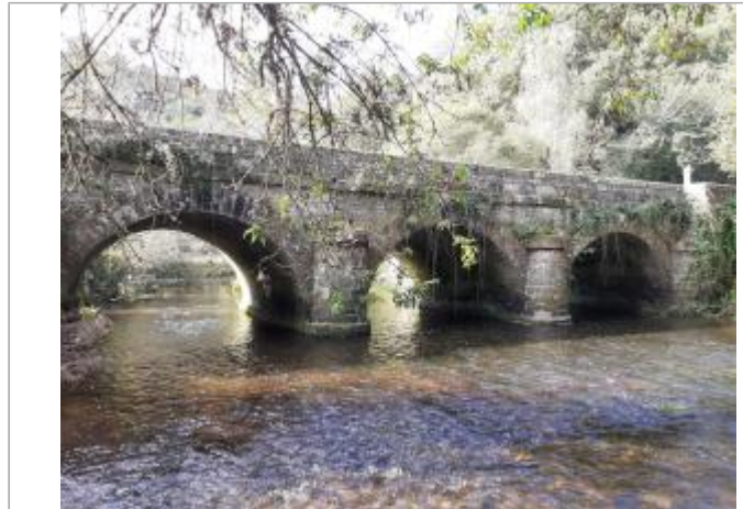
Pont sur le Scorff entre Pouay et Arzano