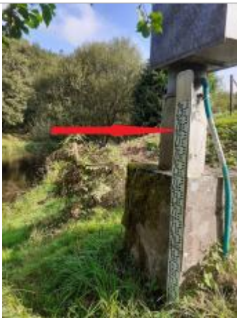
Echelle limnimétrique n°2 en amont du pont

Altitude calculée de l'eau (en m) : 18.102 m