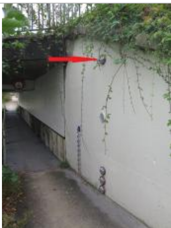
vue des repères du passage piéton

Altitude calculée de l'eau (en m) : 28.02 m