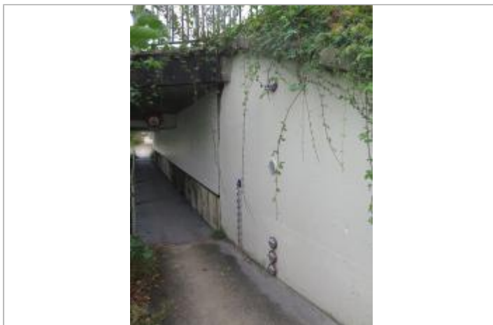
Vue générale du passage piéton à l'amont du pont