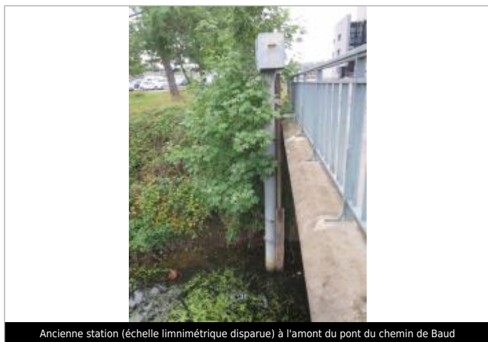
Ancienne station (échelle limnimétrique disparue) à l'amont du pont du chemin de Baud

Altitude calculée de l'eau (en m) : 27.13 m