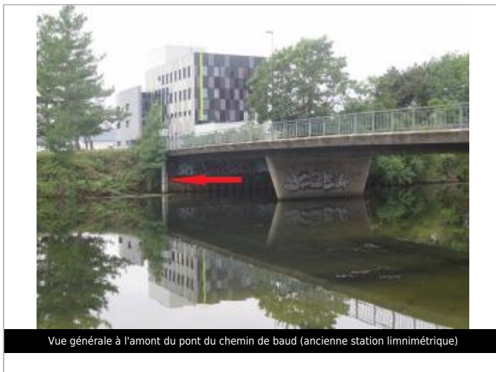
Vue générale à l'amont du pont du chemin de baud (ancienne station limnimétrique)