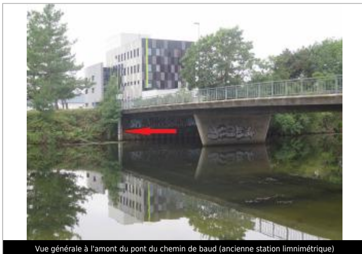
Vue générale à l'amont du pont du chemin de baud (ancienne station limnimétrique)