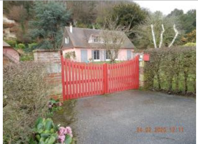
1303 route des Méandres (Quai de Seine).Pelouse devant pavillon.