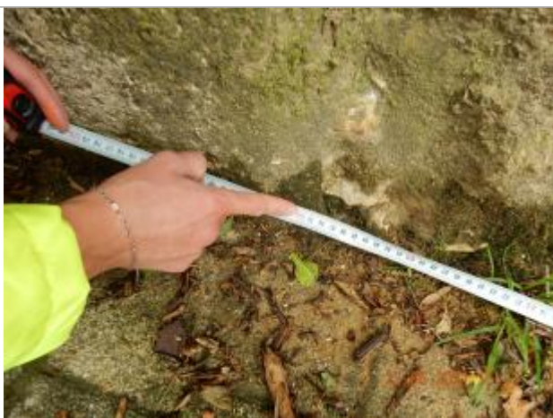
Marque de peinture sur pavés

Altitude calculée de l'eau (en m) : 104.559