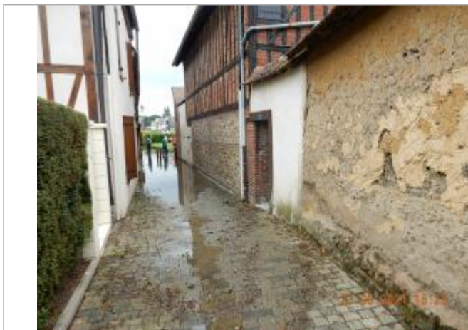
Ruelle des Prés sur les pavés