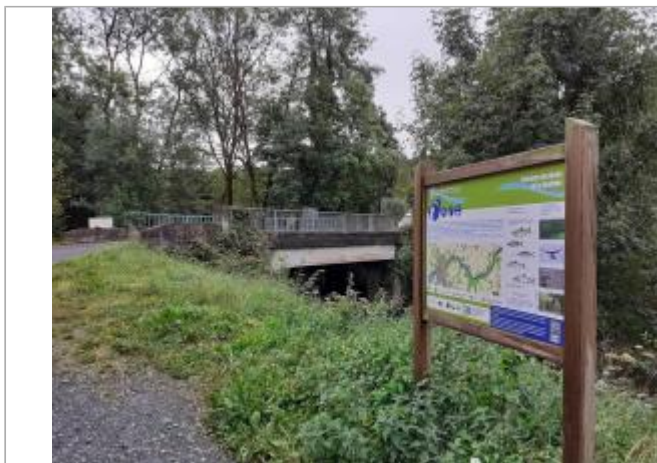
vue générale du site de la station hydrométrique de la Douffine