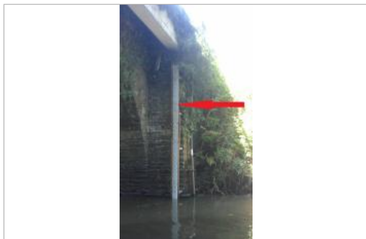
Echelle de la station limnimétrique de la Douffine à Saint-Segal - Lopérec

Altitude calculée de l'eau (en m) : 19.004 m