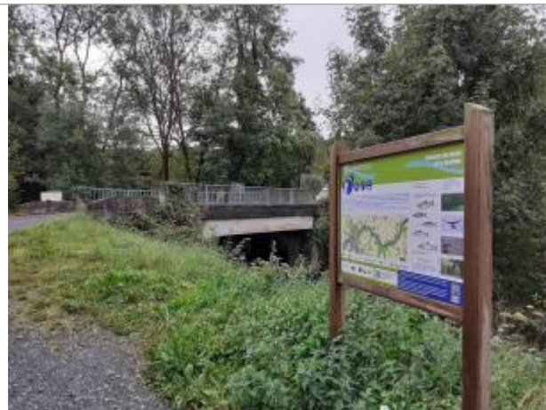
vue générale du site de la station hydrométrique de la Douffine