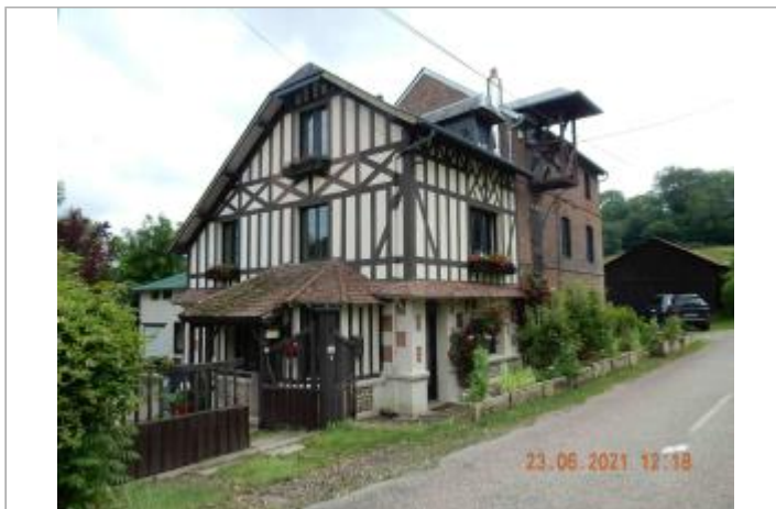
107 route de Cernières/Echanfray (D 33)