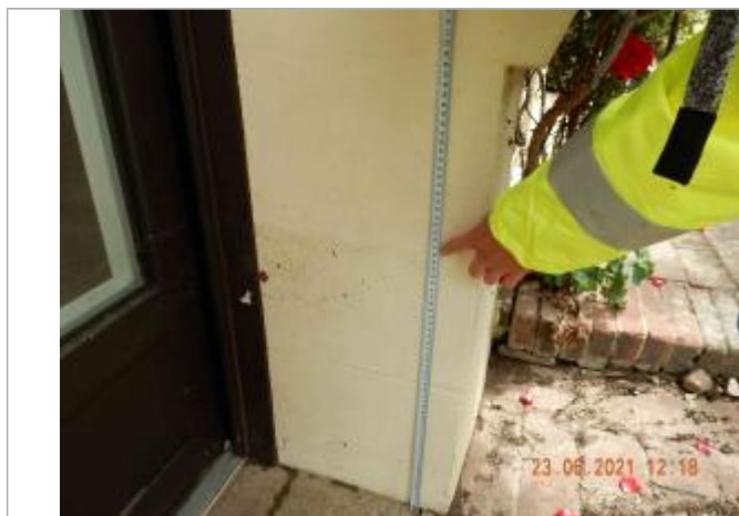
laisse de crue sur la porte d'entrée à 46 cm/sol

Maximum de l'inondation : Oui Visibilité : Oui État du repère : Bon Pérennité : Longue