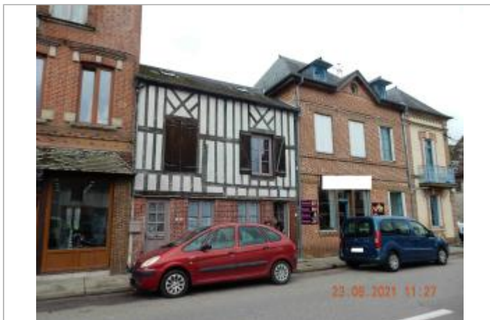
20 rue Grande