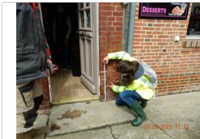
Laisse de crue sur mur à 29 cm/sol

Altitude calculée de l'eau (en m) : 168.979 m