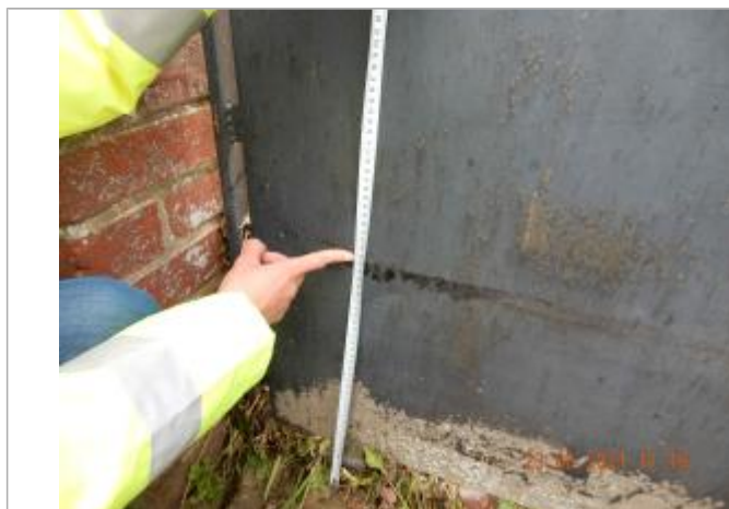
Laisse de crue sur portail à 37 cm/sol

Altitude calculée de l'eau (en m) : 169.192