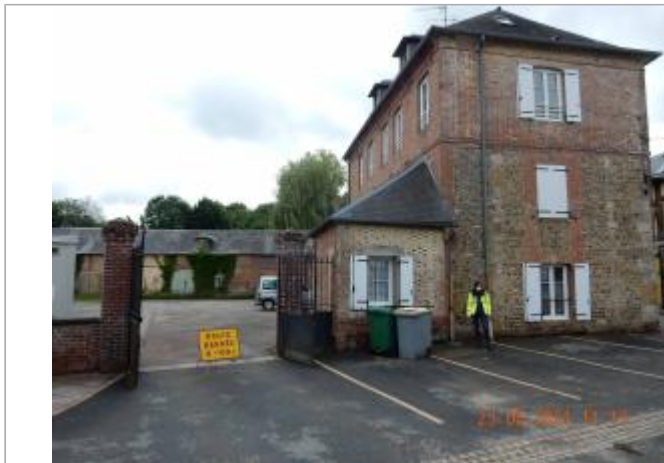
19 rue Grande, Portail de la cour du local technique de la commune