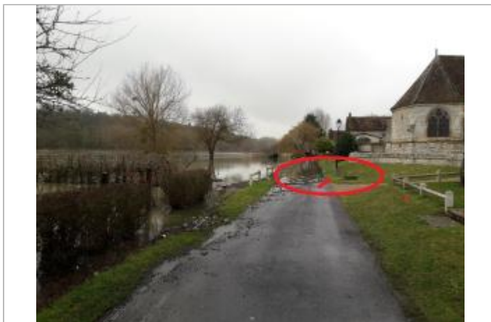
Sol devant l'église Chemin de Halage