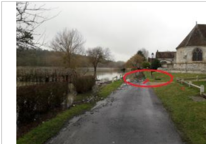
Sol devant l'église Chemin de Halage

Coordonnées WGS84 : X: 1.25382578 / Y: 49.24365280