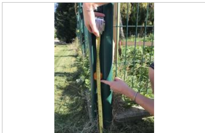
laisse de crues sur clôture metalique

NIVELLEMENT SPC SACN. LE SPC N'EST PAS GÉOMÈTRE EXPERT, LES COTES SONT DONNÉES À TITRES INDICATIF. - 03/09/2021