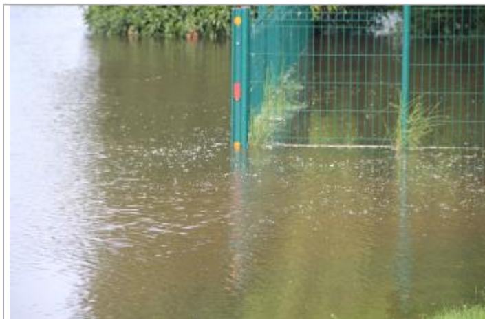
Ruelle Saint Pierre, en amont immédiat du Pont Major KC Crummer, clôture verte

GÉOLOCALISATION Coordonnées WGS84 : X: 1.09817999 / Y: 49.30677750 Coordonnées RGF93 (Lambert 93) X: 561675.62 / Y: 6913574.33 Coordonnées RGF93 (ETRS89) : X: 1.09818 / Y: 49.3067775 Code Hydro: H4--0200 Rive de référence: Gauche