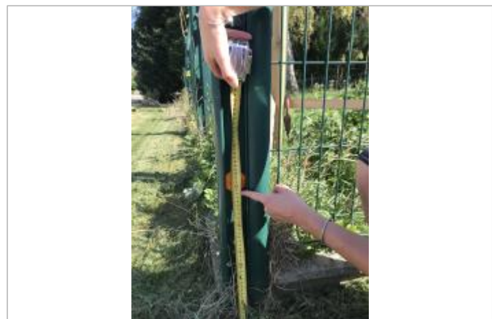
laisse de crues sur clôture metalique

GÉNÉRAL Code : WEB_R_202109082931 Date de mise à jour : Auteur : CONTRIBUT_01 10/09/2021