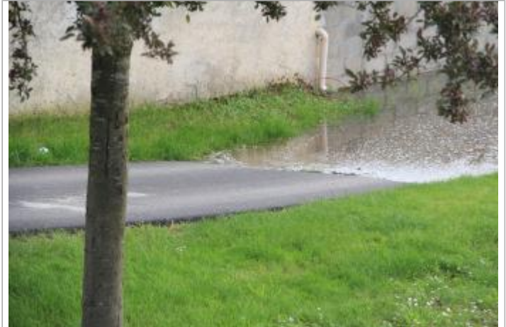
Chemin de halage au niveau du Pont Major KC Crummer (en aval)