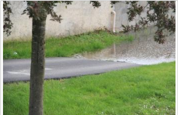
Chemin de halage au niveau du Pont Major KC Crummer (en aval)