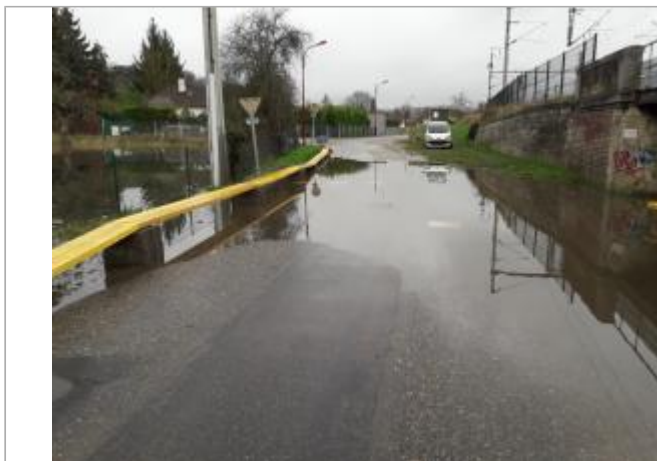
Rue du Château, à proximité du pont souterrain