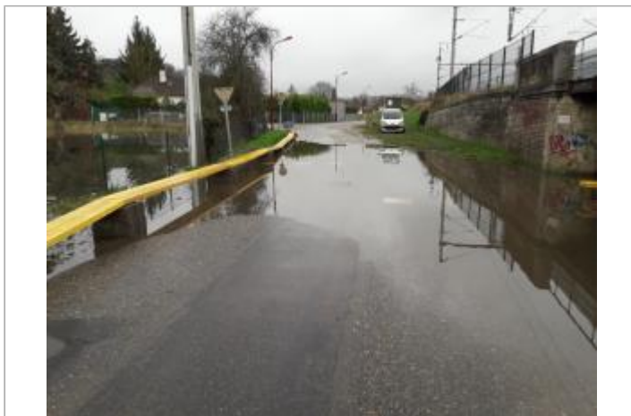
Rue du Château, à proximité du pont souterrain