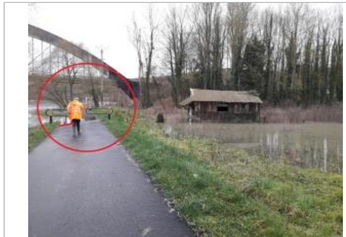
Piste cyclable qui débouche chemin de la Digue