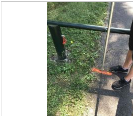
Laisse de crue au sol sur la piste cyclable

Altitude calculée de l'eau (en m) : 10.788 m