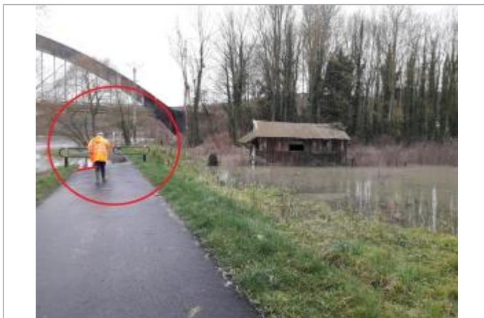
Piste cyclable qui débouche chemin de la Digue