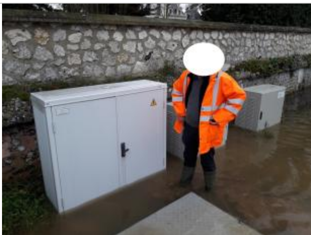
Laisse de crue à cm en dessous du gond de la porte de l'armoire électrique.