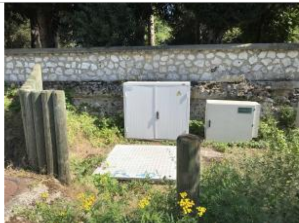
Chemin du roi (à 20 mètres de l'intersection avec la RD 313, armoire électrique)