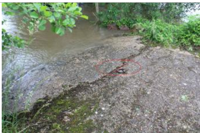
Laisse de débris de végétaux au sol

Altitude calculée de l'eau (en m) : 7.733 m