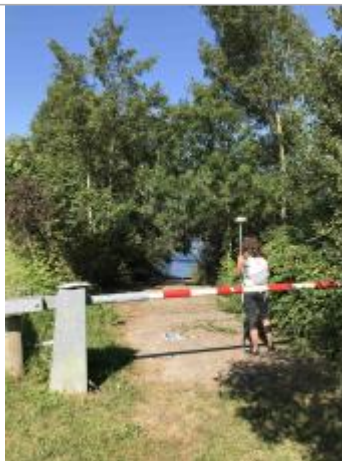
"Mise à l'eau" du barrage de Poses (rive gauche, à l'aval du barrage)