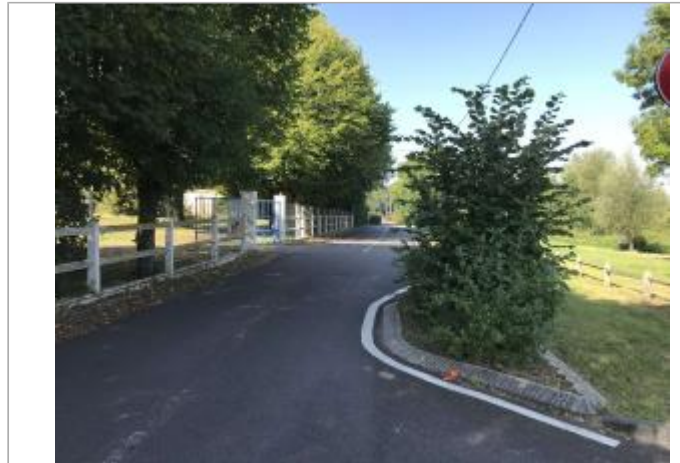
Route de l'Eure à proximité immédiate du n°46

Coordonnées WGS84 : X: 1.17759396 / Y: 49.30320340