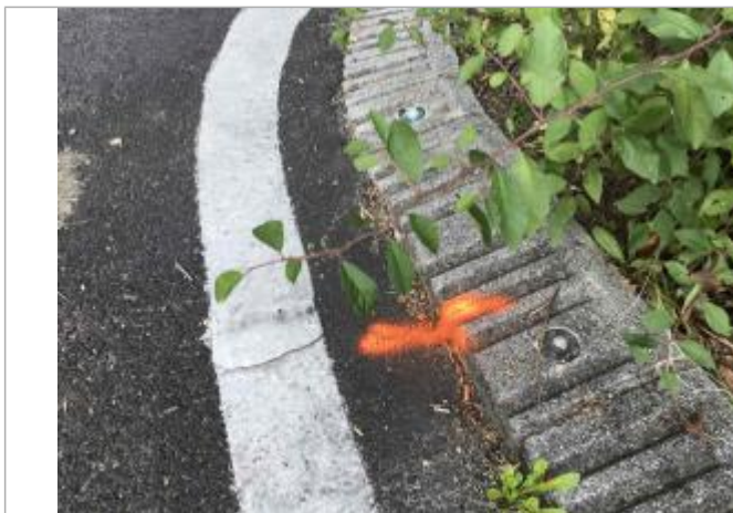
laisse de crue au sol sur bordure trottoir

Altitude calculée de l'eau (en m) : 7.018 m