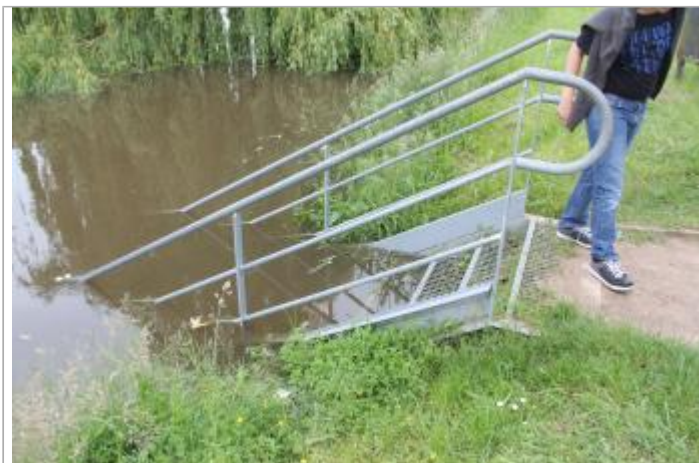
Vue du site lors de la crue