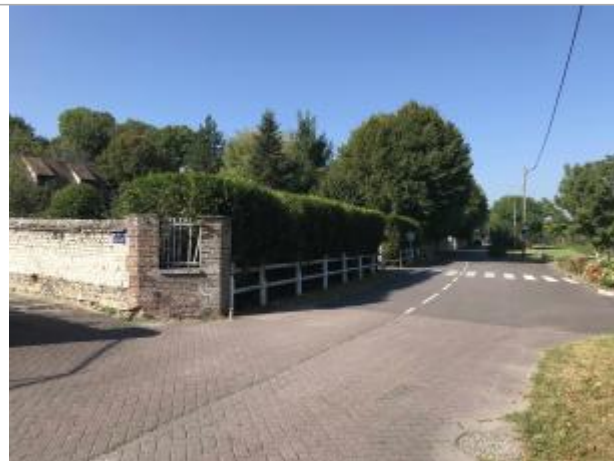
Pignon Est de l'enceinte du jardin du restaurant au 44 rue de l'Eure

Coordonnées WGS84 : X: 1.17820188 / Y: 49.30315880