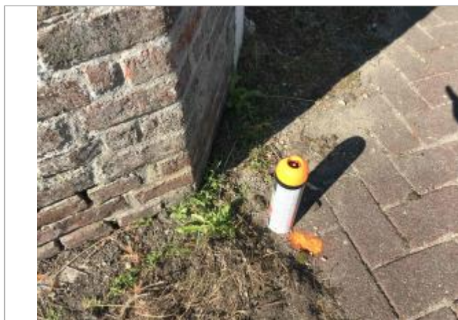
Laisse de crue au sol au niveau du pignon de l'enceinte du jardin du restaurant

NIVELLEMENT SPC SACN. LE SPC N'EST PAS GÉOMÈTRE EXPERT, LES COTES SONT DONNÉES À TITRES INDICATIF. - 03/09/2021