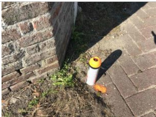
Laisse de crue au sol au niveau du pignon de l'enceinte du jardin du restaurant

NIVELLEMENT SPC SACN. LE SPC N'EST PAS GÉOMÈTRE EXPERT, LES COTES SONT DONNÉES À TITRES INDICATIF. - 03/09/2021