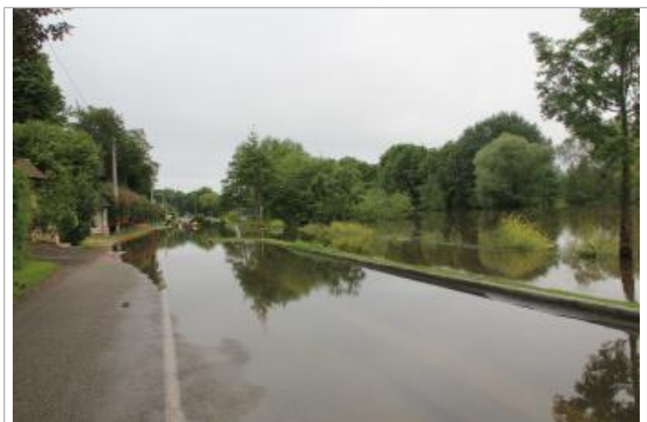
Laisse de crue au sol recouvre l'intégralité de la chaussée

MARQUE Texte : Laisse de crue au sol recouvre l'intégralité de la chaussée Maximum de l'inondation : Non renseigné Visibilité : Non État du repère : Bon Pérennité : Longue