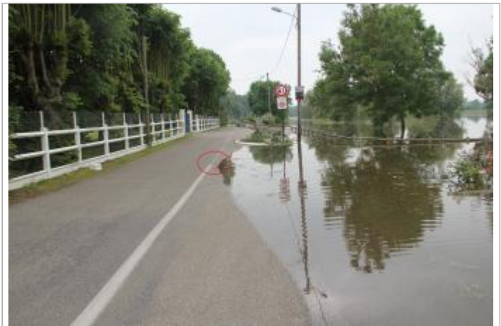
Route de l'Eure à proximité immédiate du n°46

GÉOLOCALISATION Coordonnées WGS84 : X: 1.17772095 / Y: 49.30320410 Coordonnées RGF93 (Lambert 93) X: 567450.62 / Y: 6913040.49 Coordonnées RGF93 (ETRS89) : X: 1.177721 / Y: 49.3032041 Code Hydro: H4--0200 Rive de référence: Gauche