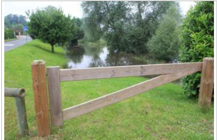
Parc en contrebas du Quai Maréchal Foch