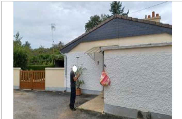
Agence bancaire 36 rue Grande