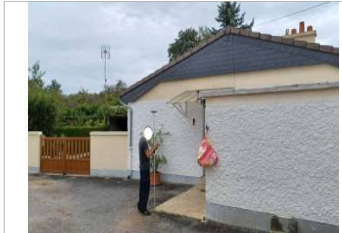
Agence bancaire 36 rue Grande