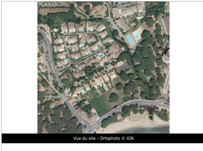
Vue du site - Orthophoto