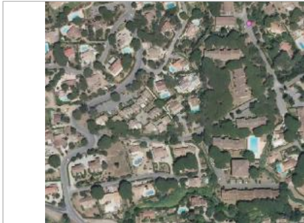
Vue du site - Orthophoto

Coordonnées WGS84 : X: 6.67957758 / Y: 43.34583630