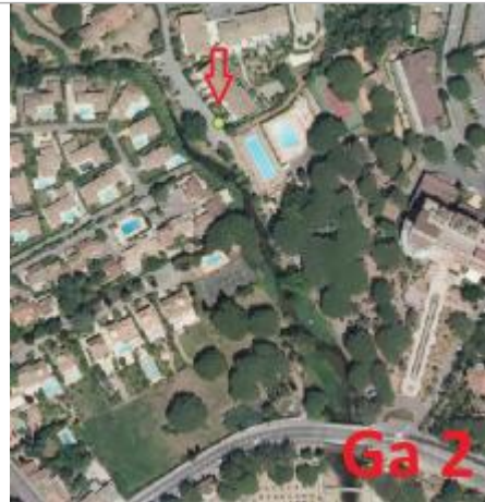
Vue du site - Orthophoto

Coordonnées WGS84 : X: 6.68151012 / Y: 43.34318400